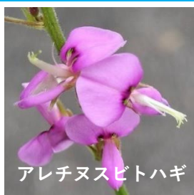
アレチヌスビトハギ